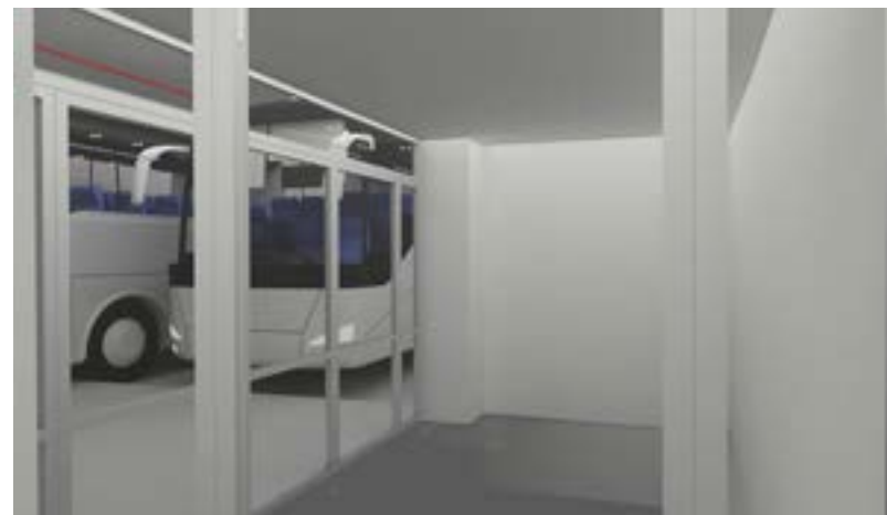
אוטובוסים (הדמיה), 2018