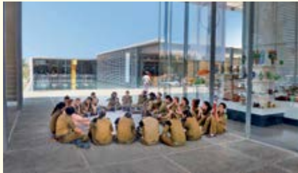
אגודת הידידים מממנת כניסה חינם לחיילים בשירות חובה ולמשרתים שירות לאומי

לדוא"ל learo@imj.org.il , 6771344, 6708815