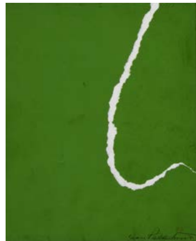
אוסף ארתור ומדלן שאלט לג'ואה, שציווה מדלן שאלט לג'ואה, ניו-יורק, לידי מוזיאון ישראל בארה"ב

מרכז המידע לאמנות ותרבות יהודית ע"ש אן ואיזידור פאלק, אולמות תצוגת הקבע