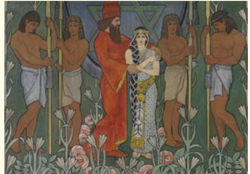
אפרים משה ליליין, "חתונה אלגורית" (פרט), מתווה לשטיח לדיוד ופרומה וולפסון, 1906