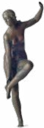
צלמית אפרודיטה , התקופה הרומית, המאה ה־1 עד ה־2 לספירה, אשקלון רשות העתיקות

אלפי חפצים מן התקופה הפרהיסטורית ועד לתקופה העות'מאנית, ובהם פסל בן 9,000 מיריחו ותכשיטי זהב מתקופת הברונזה, מלוויים ב־48 תצלומים המתעדים את פעילותם הענפה של חלוצי הארכאולוגיה בארץ בעשורים הראשונים של המאה ה־20 ומוצגים במבנה מנדטורי מיוחד זה.