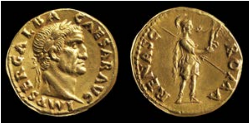
אוראוס של גלבה, רומא, 68/69 לספריה