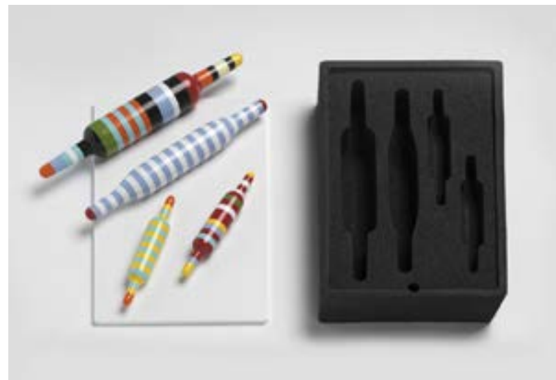
ניצן כהן, ערכת מערכים לאפיית מצות, 2017. אוסף המעצב, מילנו