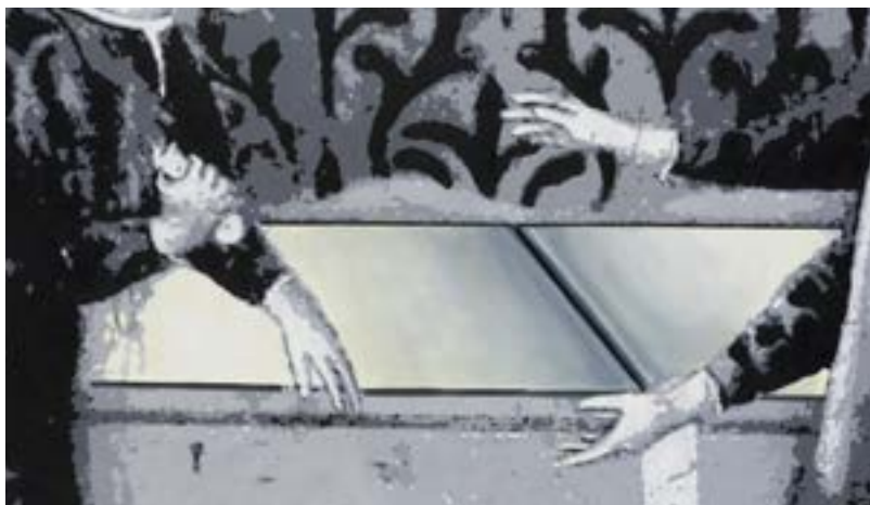
היעלמות, 2017.

זרותו ומלאכותיותו של המיצב בתוך חללי המוזיאון מטעינות את חוויית הביקור במתח ובמסתורין. המבקר, שנקלע לחניון בתוך אולמות התצוגה, מאבד את חוש ההתמצאות שלו ומוצא את עצמו במקום זר, אפל ולא שייך, שהרבה דברים עלולים להתרחש בו.