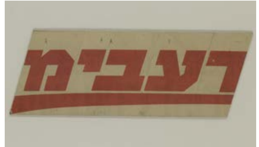
גיא קריידן, רעבים, 2002