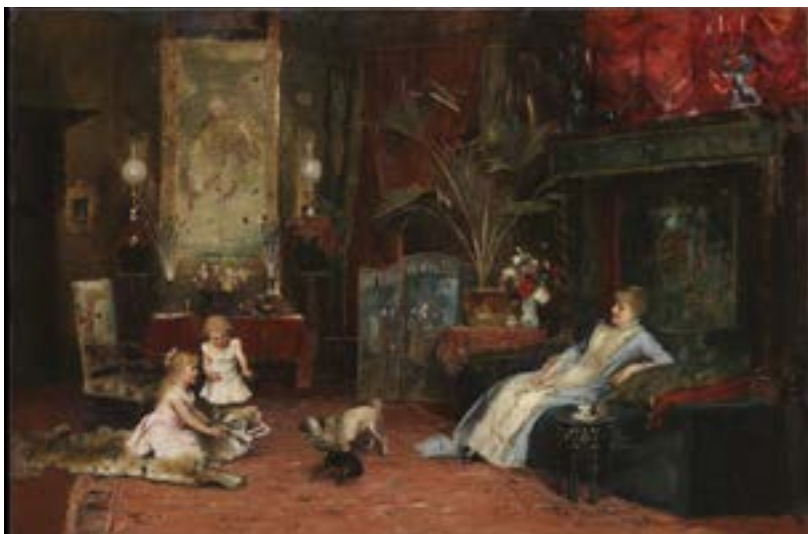
מיהאי מונקצ'י, עור נמר, לא מתוארך. עיזבון קלרה גומבוס-קלן, ניו־יורק, לידידי מוזיאון ישראל בארה"ב