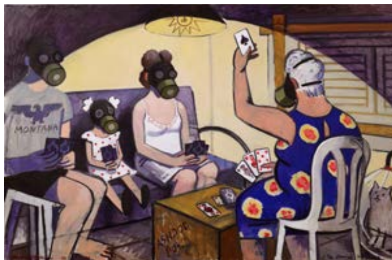
זויה צ'רקסקי המתקפה הכימית, 2016. אוסף האמנית וגלריה רוזנפלד, תל־אביב

אולם ע"ש פרד ודלה וורמס מדריך קולי שיחי גלריה – ראו עמ' 26