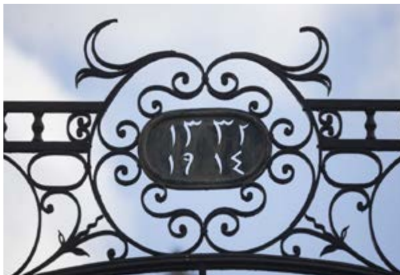
שער הכניסה לחצר האוריינט האוס, רח' אבדעוביידה 8, שיח' ג'ראח.