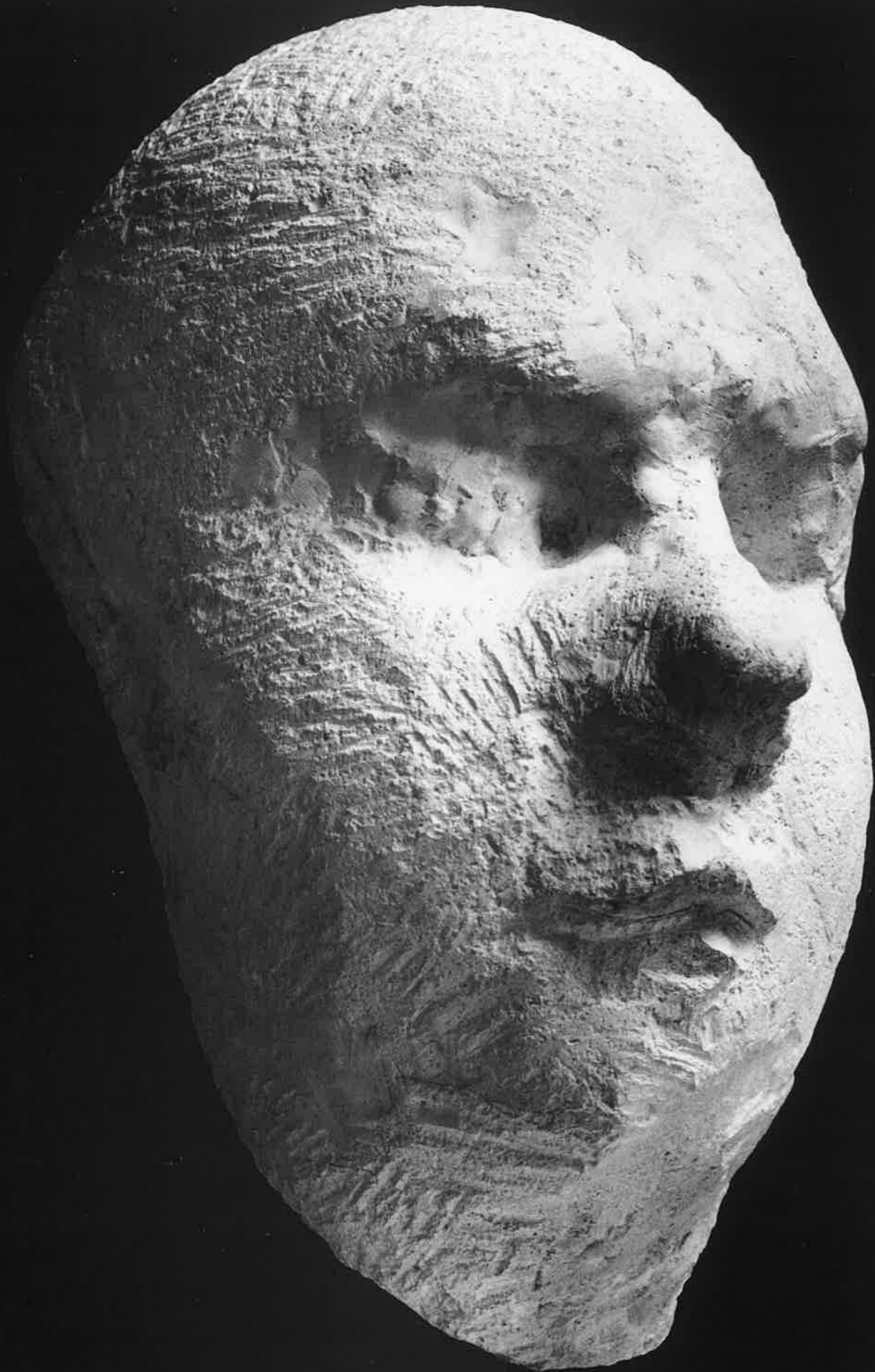
צביקה לחמן, "ראש מונח", 1988-89, גבס, 170x38x22