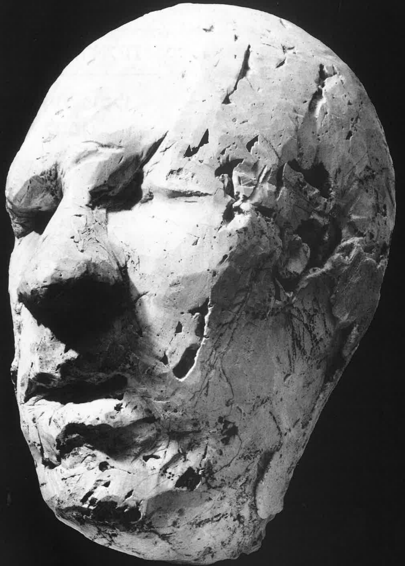
צביקה לחמן, "חנה", 1985-89, מלט לבן, 170x40x30