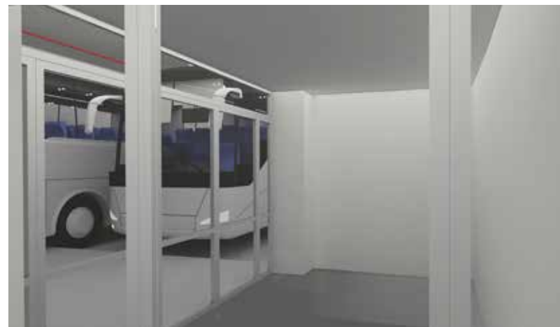
אוטובוסים (הדמיה), 2018