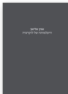
קטלוג 99 ש"ח

הביתן לאמנות ישראלית ע"ש אילה זקס אברמוב