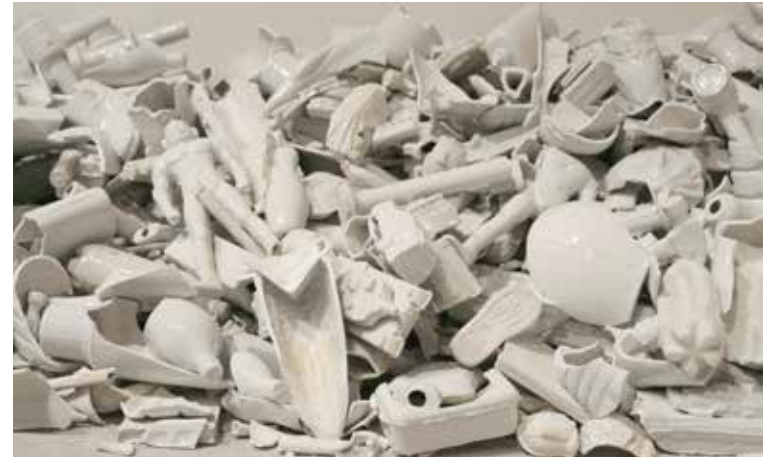
ליו ג'יאנחואה, הושלך (פרט), 2017

אגף הנוער והחינוך לאמנות ע"ש רות מדריך קולי למשפחה