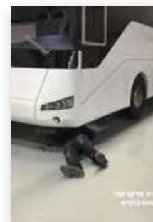
קטלוג | 129 ש"ח