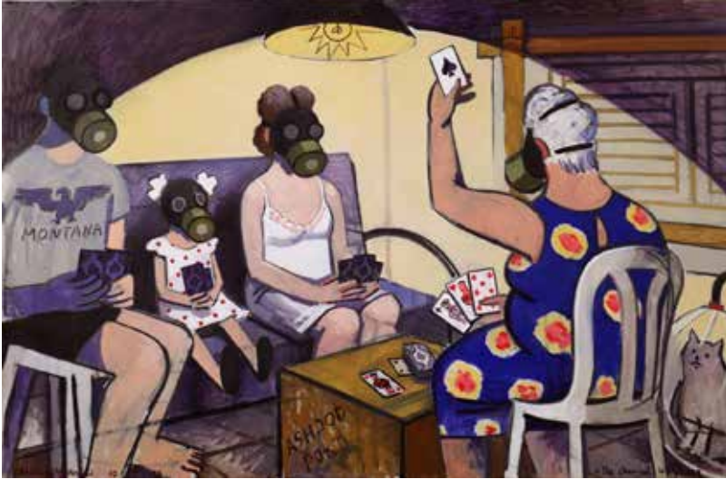
המתקפה הכימית, 2016. אוסף האמנית וגלריה רוזנפלד, תל-אביב