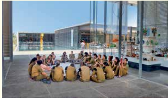
אגודת הידידים מממנת כניסה חינם לחיילים בשירות חובה ולמשרתים שירות לאומי

דוא"ל learo@imj.org.il , 6771344, 6708815