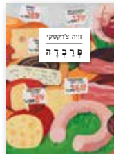
קטלוג עברית-אנגלית-רוסית 129 ש"ח