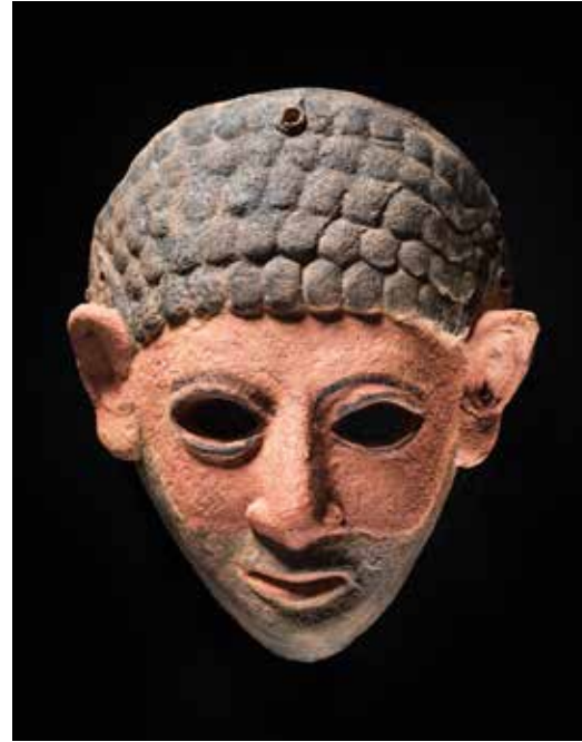
מסכת גבר פיניקי, לחיצה מודרנית בתבנית בת כ־3000 שנה שנמצאה בשלמותה באכזיב