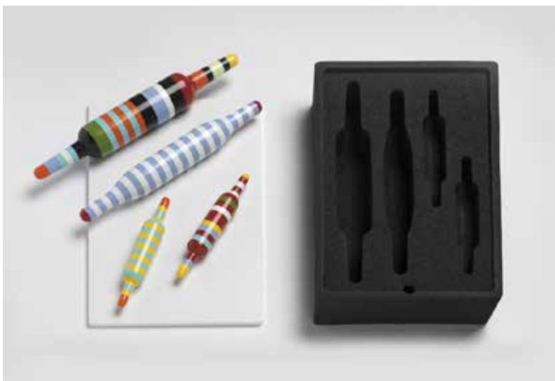
ניצן כהן, ערכת מערוכים לאפיית מצות, 2017. אוסף המעצב, מילנו