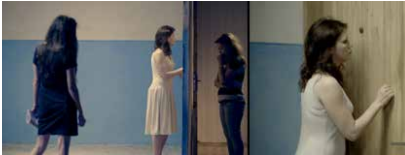
על סוליות זרות (פרט מעבודת וידאו), 2017. מתנת וויאן אוסטרובסקי, ניו-יורק, לידי מוזיאון ישראל בארה"ב