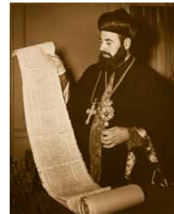
אתנסיס ישוע סמואל