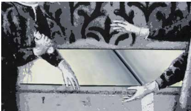
היעלמות, 2017. באדיבות האמן וגלריה ברוורמן, תל-אביב