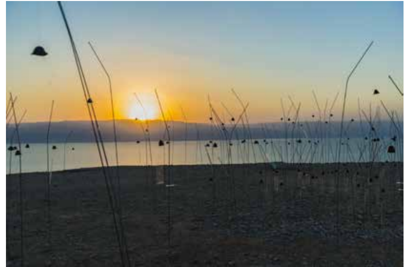
נשמות קטנות (ים המוות; פרט מעבודת וידאו), © Christian Boltanski 2017