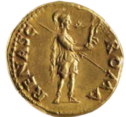
אוראוס של גלבה, רומא, 68/69 לספריה