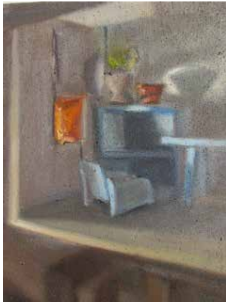
בלי כותרת, 2016. אוסף האמנית

מסעדת אנה טל' 5434144 host@annarest.co.il